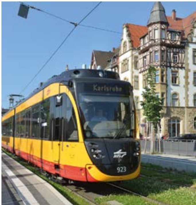
Das Liniennetz der Stadtbahn: über 400 km in der Region