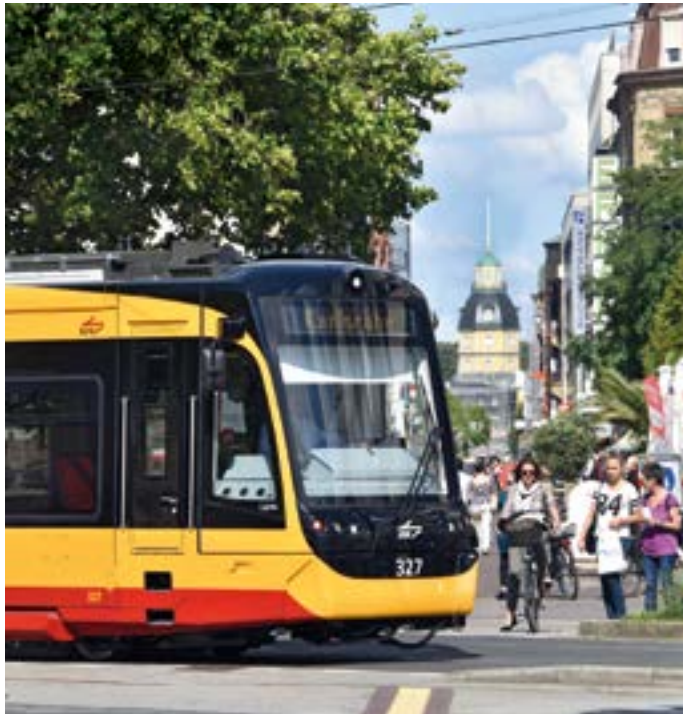
Bequem und komfortabel die Niederflerbahnen im KVV